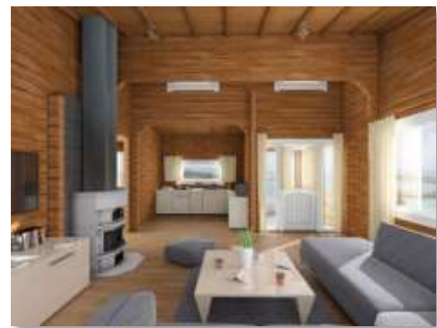
Viel Platz für Gemütlichkeit