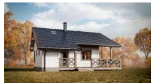
Natur genießen im Wohnhaus „Brixen“