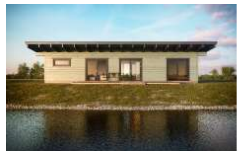
Drei große Fenster und viel Licht im Wohnbereich