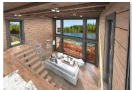
Blick von der Empore