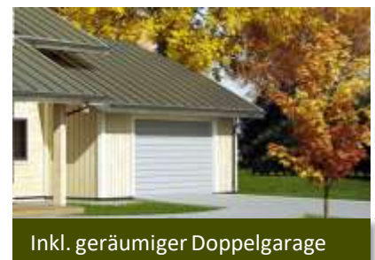
Inkl. geräumiger Doppelgarage